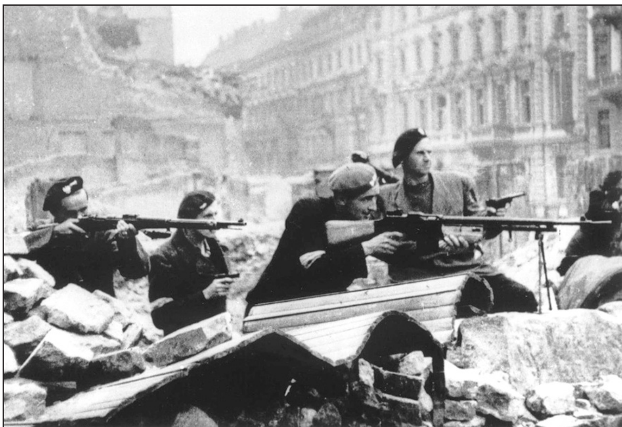
“Una bala, un alemán” dijeron los insurrectos.

Norman Davies, los planes de la campaña soviética marcaban que Rokossovski debía tomar Varsovia el 2 de agosto. Y ese día habría contemplado la ciudad, que estaba en llamas, desde el otro lado del Vístula, mientras comenzaba a responder un contrataque alemán contra sus tropas que lo había demorado. Junto con el general Zhukov enviaron una propuesta