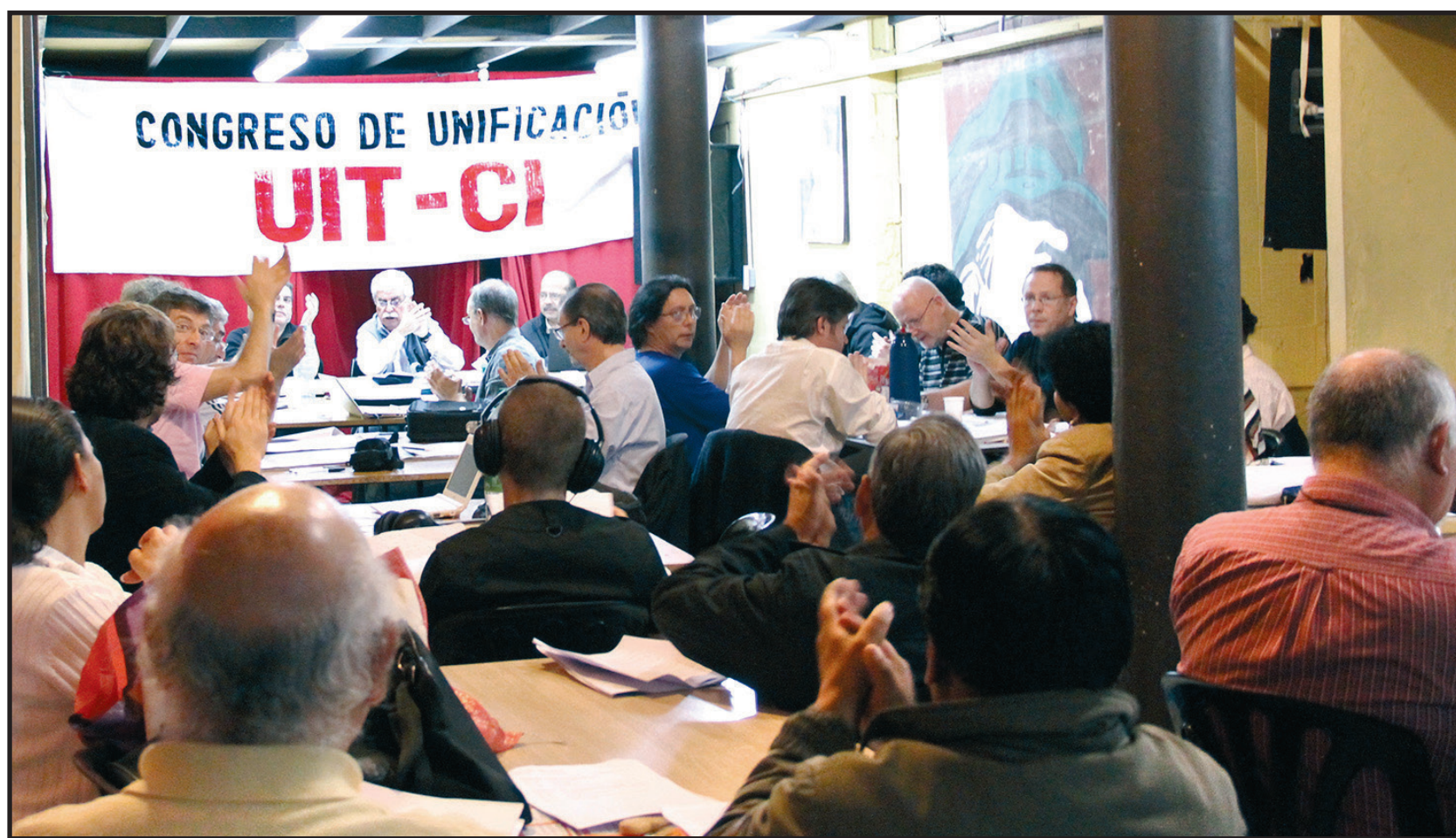
Vista del congreso donde participaron representantes de catorce países

En ese sentido, aportamos nuestra propia experiencia. Nuestra unidad se basó en un acuerdo político principista, en primer lugar, alrededor de los hechos más destacados de la lucha de clases, como lo es la revolución del Norte de África y Medio Oriente que se inició en Túnez en el 2011, en el apoyo a la revolución siria contra el