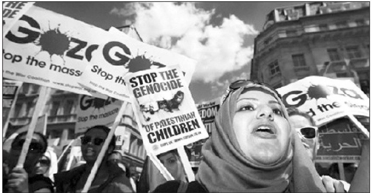
Multitudinaria marcha de apoyo a Palestina en Londres

"Cuanto más se pospone el cese de fuego la situación en Cisjordania se va transformando gradualmente en insostenible. De aquí la urgencia del presidente Palestino (Abbas que gobierna en Cisjordania, la otra parte