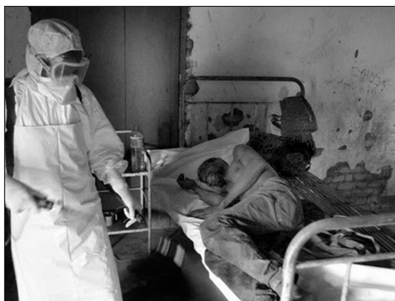
Ebola es una enfermedad mortal y sumamente contagiosa.

La diferencia es que el ébola, por ahora, es imparable y puede propagarse a occidente. En medio de este clima de terror, las multinacionales del laboratorio ya olfatearon altas ganancias. La empresa estadounidense Mapp Biopharma-