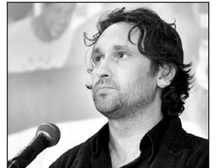
Turquía Esat Partido Democracia Obrera

Venimos de una región donde hay revueltas populares, guerras, huelgas obreras y luchas de resistencia. En nuestro país distintos sectores de la clase obrera están luchando por sus derechos. El pueblo kurdo está dando una lucha heroica por su libertad hace más de 30 años. En nuestro vecino del sur, Siria, la lucha del pueblo contra el dictador Assad ha entrado en su cuarto año. Bajo los ataques con bombas el pueblo sirio continúa su camino hacia la libertad. Y también nuestra vecina Grecia, está bajo el efecto de la crisis económica y oleadas de huelga sacuden el país. También hay luchas, guerras y movilizaciones en Ucrania, Irán y en Chipre. El gobierno de Erdogan utiliza un discurso pro palestina, pero al mismo tiempo su gobierno aumenta el volumen del comercio entre Turquía e Israel. Exigimos al gobierno turco que corte las relaciones económicas, militares y diplomáticas con Israel.