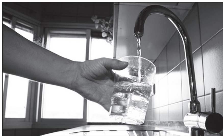
La quita de subsidios es un nuevo golpe a los trabajadores y el pueblo

rían), cómo si se pudiera prescindir de un servicio tan esencial. ¿Por qué hacer pasar este suplicio a miles de personas, mayormente jubilados, si el gobierno a través de la ANSeS puede saber quien percibe algún tipo de beneficio de seguridad social? Invierten la “carga de la prueba”. Lamentable. Lo cierto es que millones de trabajadores y demás sectores populares sufrirán un nuevo ataque a sus ingresos populares. Tarifazo que además incentivará fuertemente la suba de precios.