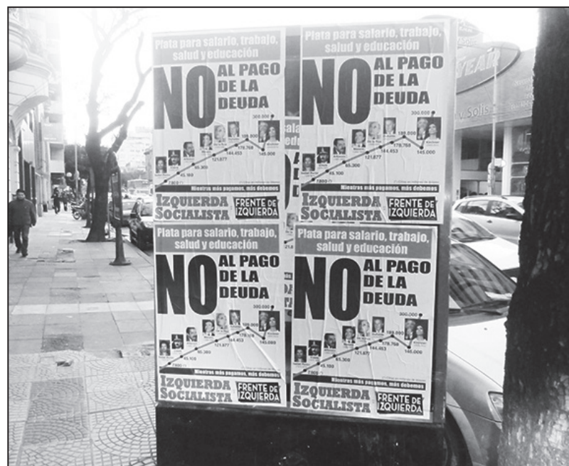
Carteles de nuestro partido reclamando el no pago

como del conjunto de la oposición patronal se pueden sintetizar en una oración: pagar todo, tanto a los buitres que no entraron en los canjes anteriores, como a los no menos buitres que sí lo hicieron, más todos los pagos pendientes al Ciadi, al Club de París y a cuanto especulador financiero internacional ande por el mundo y presente un “título de deuda” contra la Argentina.