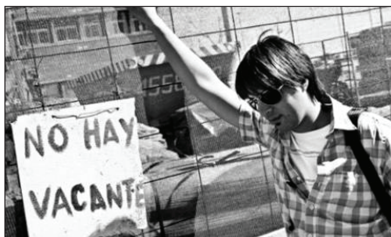
Los jóvenes son los que más sufren la falta de empleo y la precarización laboral

Según estadísticas oficiales, un joven varón, de entre 18 y 24 años sin estudios completos tiene apenas un 17% de posibilidades de acceder a un trabajo registrado. Con este “maravilloso” plan, sus posibilidades aumentan a un mísero 45%. Toda empresa que