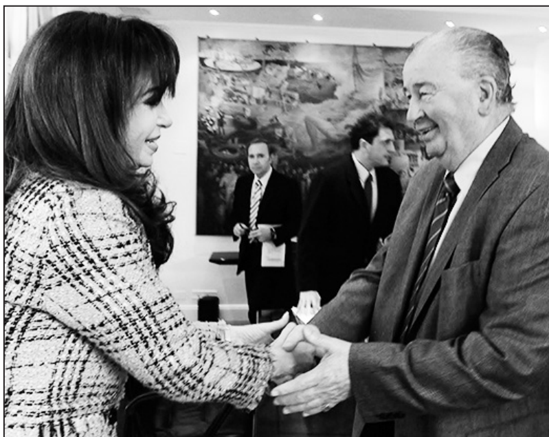
Fútbol para Todos: un negocio redituable tanto para la AFA como para el kirchnerismo

Durante su largo mandato se extendieron como una mancha de aceite dos fenómenos sumamente emparentados que han ido destrozando la fiesta popular que significa el fútbol: la corrupción y la violencia "barrabrava". Casi sin excepción, todos los clubes del fútbol argentino atraviesan situaciones de mega multi millonarios pasivos económicos a los que llegan luego de años y años