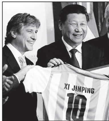
Boudou con el dictador chino

La oposición le hizo el vacío en la Cámara de Senadores reclamando el juicio político o su licencia. Pero nadie se pronuncia para que Boudou vaya preso. Ante cualquier sospecha delictiva cualquier persona puede terminar en la cárcel. Este corrupto,